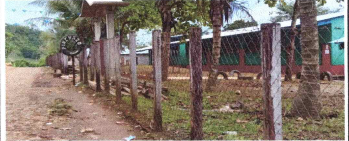
FOTO 2 PARTE FRONTAL DEL ESTABLECIMIENTO DONDE SE VA A CAMBIAR EL CIRCULADO