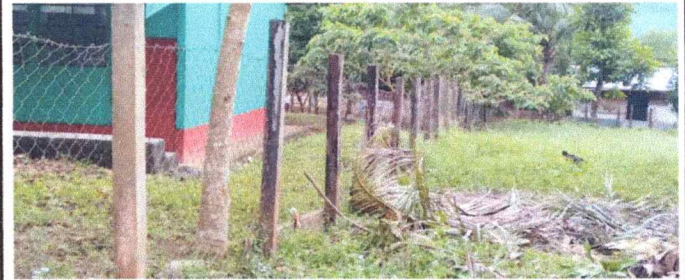
FOTO No. 4 SE OBSERVA MALLA EN MAL ESTADO NECESITA SER SUSTITUIDA