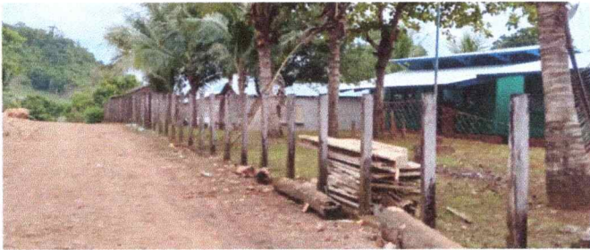
FOTO No. 3 SE OBSERVA MALLA EN MAL ESTADO Y POSTES PODRIDOS, MURO PERIMETRAL SERA SUSTITUIDO POR BLOCK Y PILARES DE CONCRETO