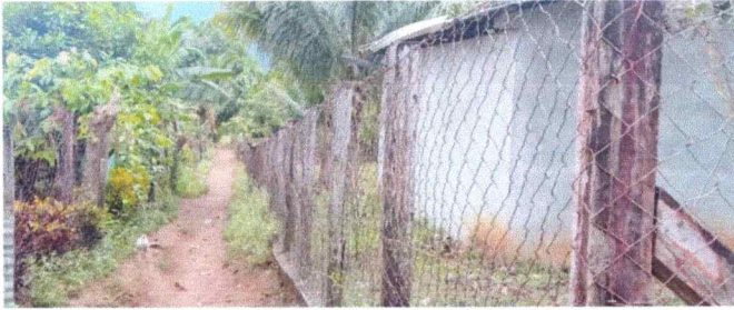
FOTO NO. 1 SE OBSERVA LA CIRCULACION DEL ESTABLECIMIENTO EN MAL ESTADO